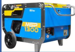
MSP 1300 8808€