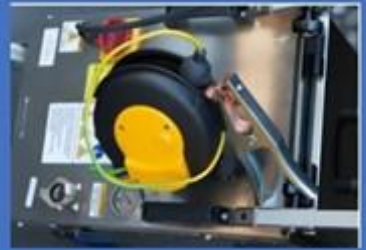
Dérouleur de tresse 6mm 2 379,35€