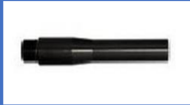
Buse ronde 5.5 plastique 350,20€