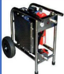
AT 160 Assécheur Déshuileur Tout en un 5013,60€

Les compresseurs produisent tous un air comprimé chaud, humide et huileux. Les moisissures de même que les particules en suspension diminuent l'efficacité du Nettoyage Cryogénique. La solution ? C'est notre AT160 "tout en un" : refroidisseur, assécheur avec filtre coalescent.