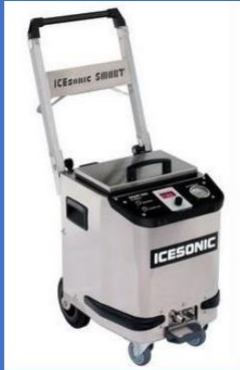
SMART pro 5783,95€